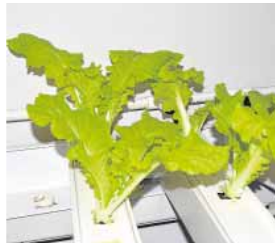
►► Cultivos ► Las lechugas hidropónicas.

Y aunque parece que la investigación no le deja tiempo libre, Pobes no se aburre en el IceCube. Además de haber hecho una gran familia con los cincuenta investigadores que se encuentran allí, tiene tiempo para ver