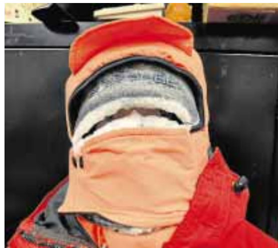
►► Deporte ► A la llegada de la media maratón.